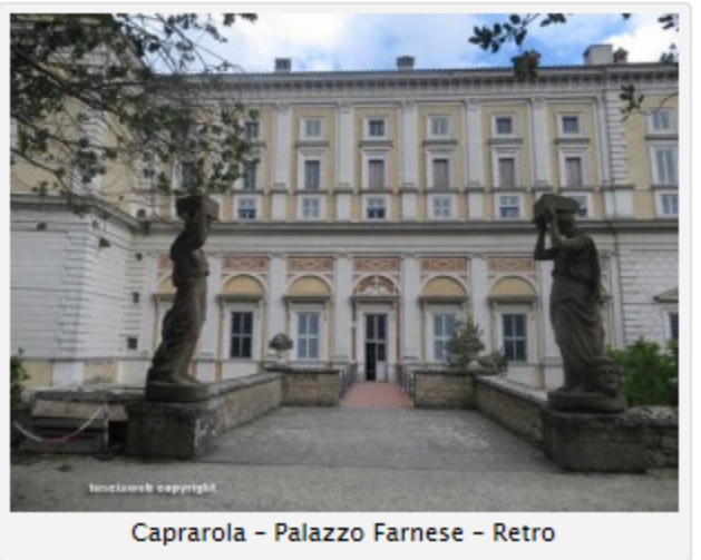
Caprarola - Palazzo Farnese - Retro

Viterbo - Riceviamo e pubblichiamo - Nei fine settimana 8-9 e 15-16 ottobre Caprarola si prepara a un nuovo bagno di folla. Presso le storiche Scuderie di Palazzo Farnese è in programma la settima edizione di CioccoTuscia, il festival dei dolci sapori e dei frutti a guscio della Tuscia, unitamente alla Festa della Castagna, l'annuale manifestazione che celebra la